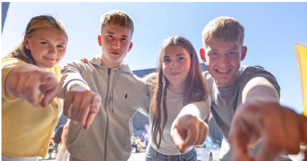
Frá UL sl. sumar

Unnið er að leiðtogafræðslu fyrir ungt fólk í samstarfi við HM sem stefnt er á að bjóða upp á í haust.