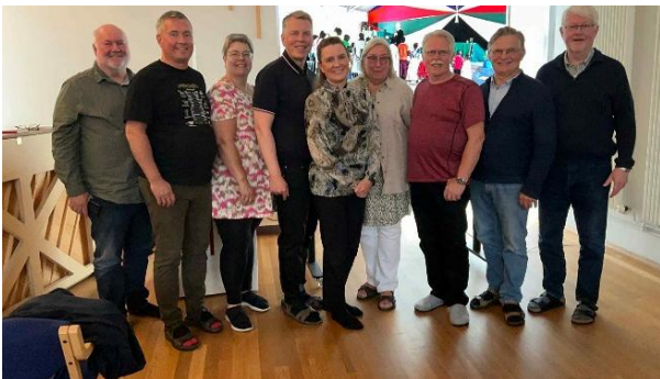
Keniufarar á Löngumýri