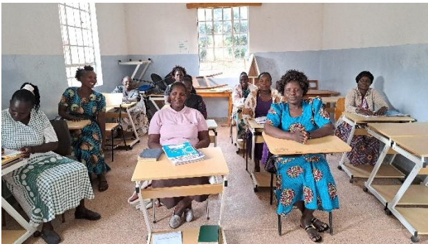
Djárnabekkurinn á Kapenguria Bible Center í Keníu

SÍK er á almannaheillaskrá og norskir skattgreiðendur geta einnig með svipuðum hætti og íslenskir styrkt SÍK og fengið frádrátt frá skatti.