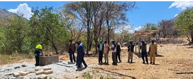
Borhola í Chespen

Eftirfarandi skýrsla beinir sjónum að starfinu, bæði heima fyrir og á alþjóðavettvangi þar sem starf SÍK og stuðningur hefur gríðarleg áhrif.