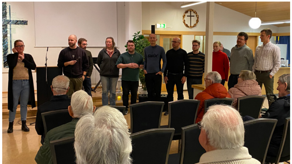
Þátttakendur fundarins tóku þátt í samkomu í Kristniboðssalnum með vitnisburði og hvatningarorðum.