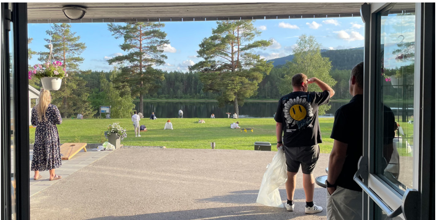
Unglingar fengu 20 mínútur til að leita Guðs eftir að þau heyrðu predikun um krossfestingu Jesú og hvað það þýðir.

sem starfað er í og einnig að virkja sem flestar kirkjur og kristilegar hreyfingar til að taka þátt og vera bakland starfsins. Á Norðurlöndunum hefur YoungLife hafið starfsemi í Noregi þar sem samtökin hafa m.a. verið í nánú samstarfi við norska kristniðóðssambandið (Misjonsambandet – NLM) og kristniðóðssamtök í Svíþjóð og