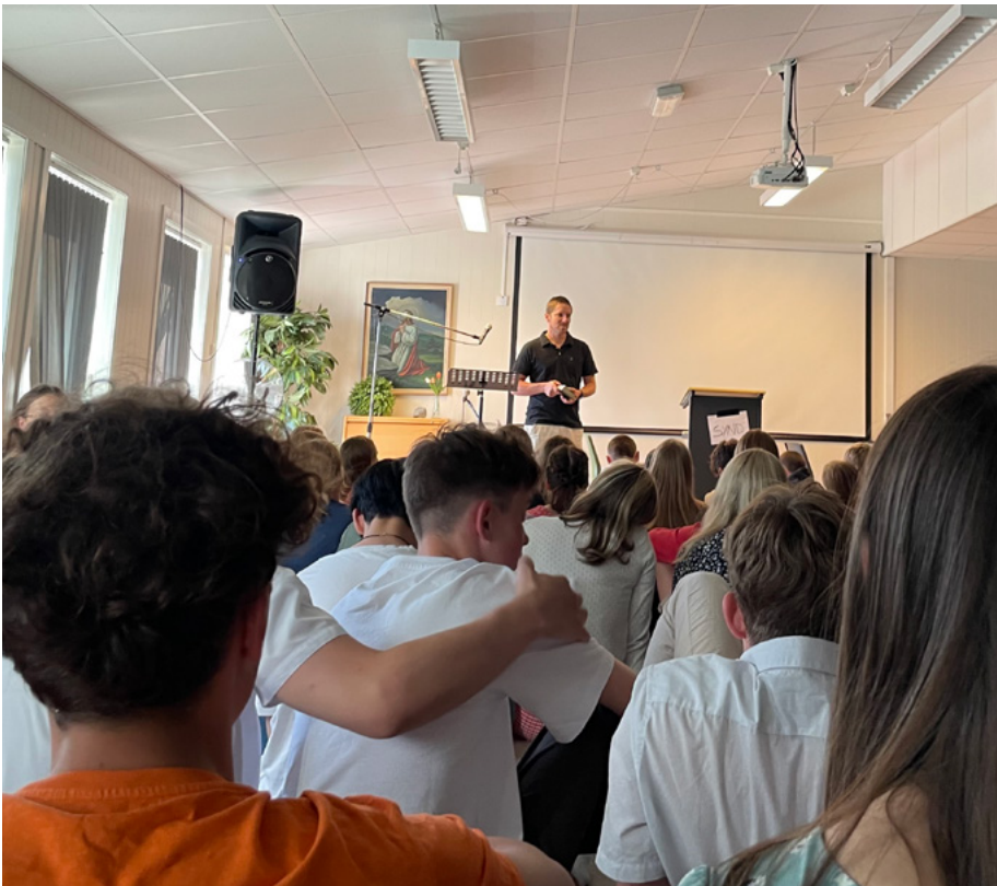
Predikun um krossinn á YoungLife sumarmóti í Noregi.