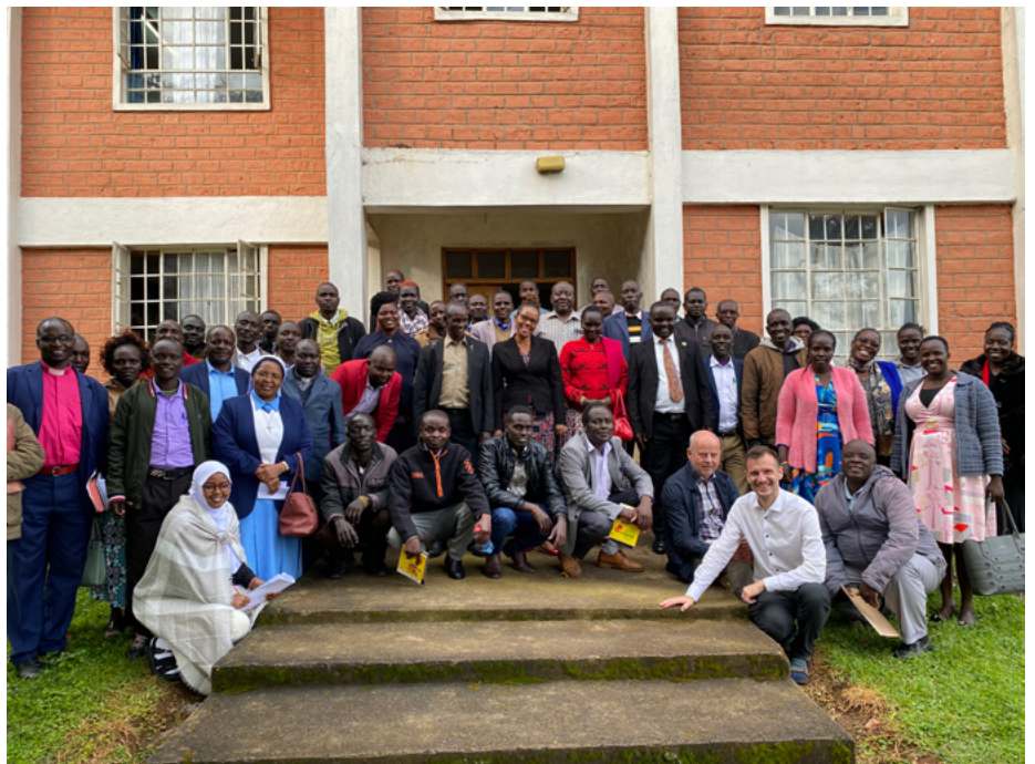
Þátttakendur í vinnustofu sem haldin var fyrir skólastjóra og formenn skólanefnda.