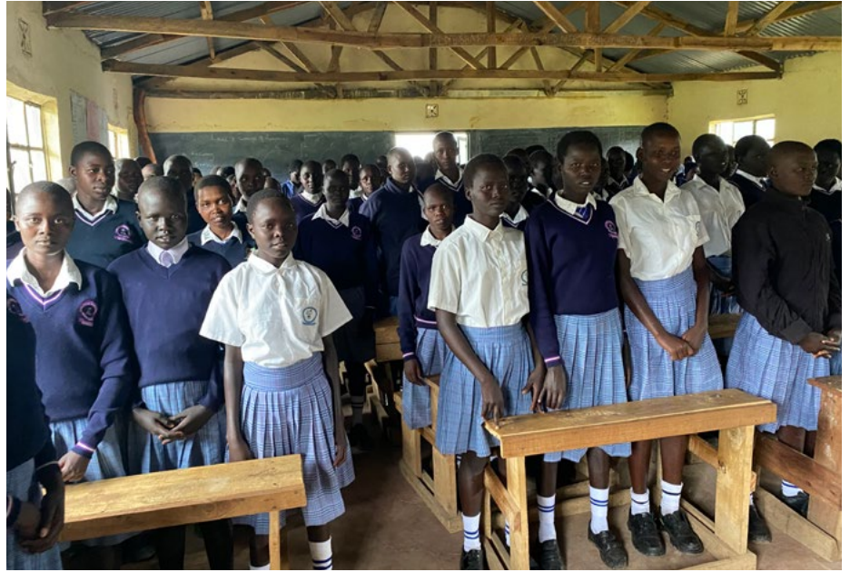
Stelpurnar í Terero

helsti vandinn þegar kemur að menntun stúlkna. Utanríkisráðuneytið hefur veitt fé til að styrkja nokkrar stúlkur og kristni-boðsvinir hafa gert slíkt hið sama. Við upphaf skólaársins nú í vor gátum við veitt þónokkrum stúlkum skólalstyrki til þess að þær yrðu ekki sendar heim vegna skuldar við skólann.