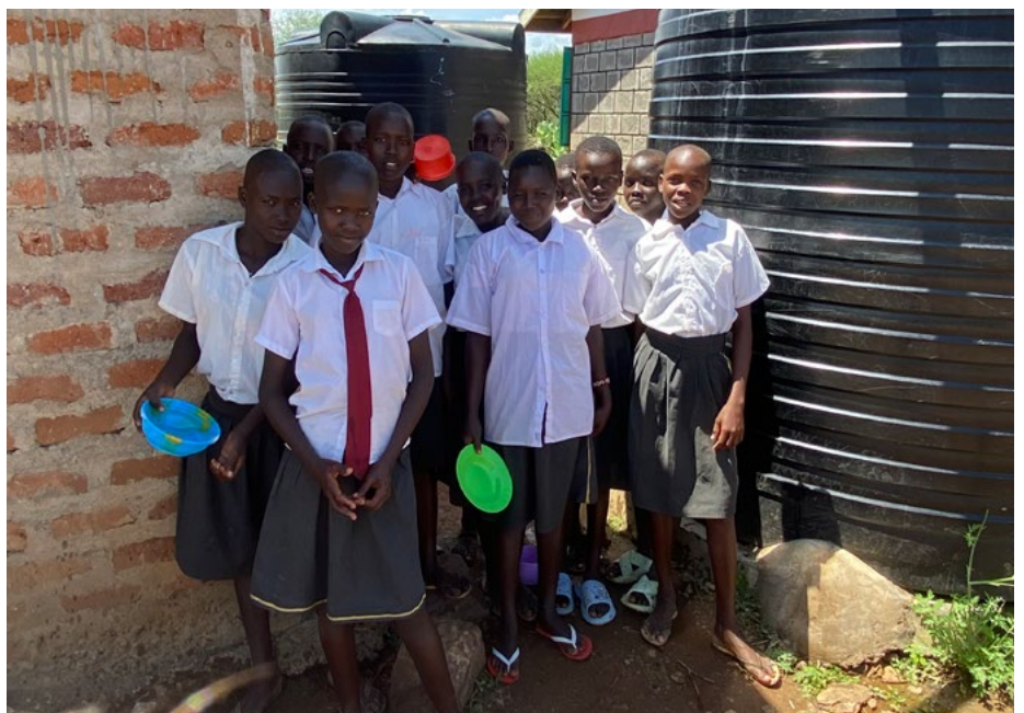
Skólastelpur í Tuwit