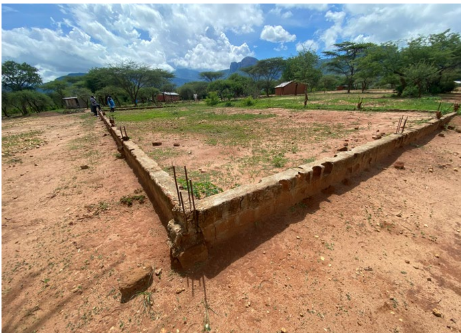
Kirkjugrunnur í Miskwony

Ég varð þess heiðurs aðnjótandi að fara í ferð til Keníu nú í maí til að kynna starfi SÍK og ELCK kirkjunnar, en kirkjan er stofnandi um 200 skóla. SÍK og utanríkisráðuneytið hafa komið að uppbyggingu margra þeirra. Eftirfarandi eru nokkur dæmi um uppbyggingu sem SÍK hefur komið að með styrkjum frá utanríkisráðuneytinu og kristniðóðsvinum.