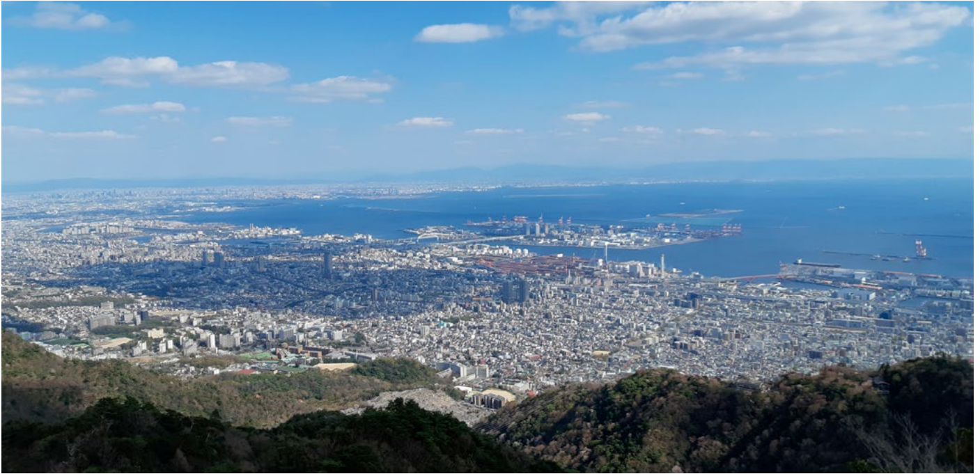
Kobe og Rokko eyja