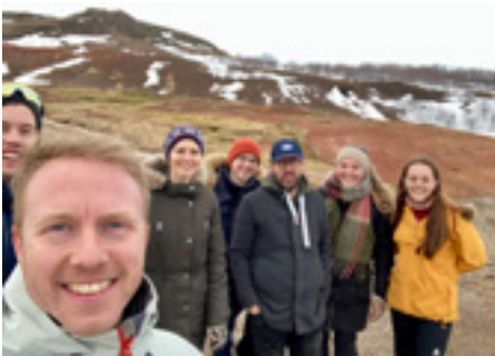
Norski hópurinn í íslenskrí náttúru.

En við komum ekki bara sem ferðamenn eða til að upplifa íslenska náttúru og