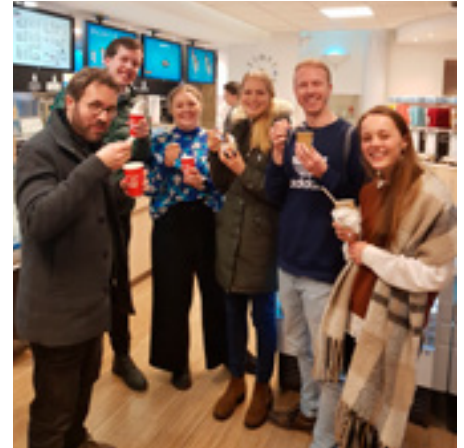
Norðmenn fá sér ís.