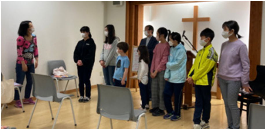
Sunnudagaskólinn á Rokko eyju.

Breytingar voru gerðar á lögum um tekjuskatt í fyrra og nú getur fólk fengið skattaafslátt vegna gjafa til starfs Kristniðóðsambandsins. Skrifstofan heldur utan um framlög og eru upplýsingar sendar til skattsins í lok árs og forskráðar á skattaframtöl. Afslátturinn kemur til endurgreiðslu þegar skattgreiðsla liðins árs er gerð upp 1. júní. Samanlagðar gjafir til almannaheilla þurfa að nema 10 þúsund krónum á ári og skattaafsláttur fæst fyrir gjafir að hámarki 350 þúsund á mann eða 700 hjá hjónum sé gefið í nafni beggja.