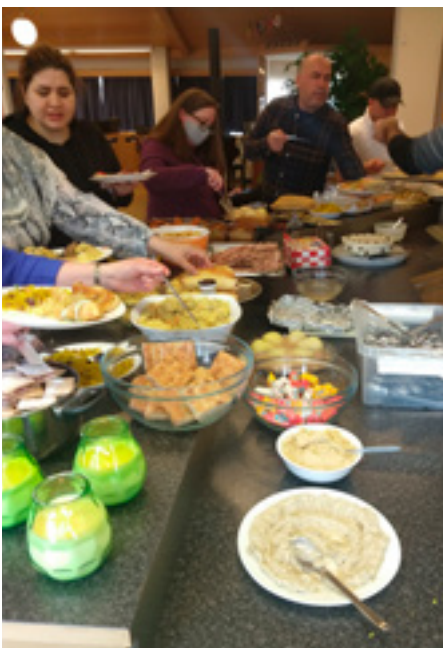
Framandi kræsingar á vorfagnaði íslenskukennslunnar.