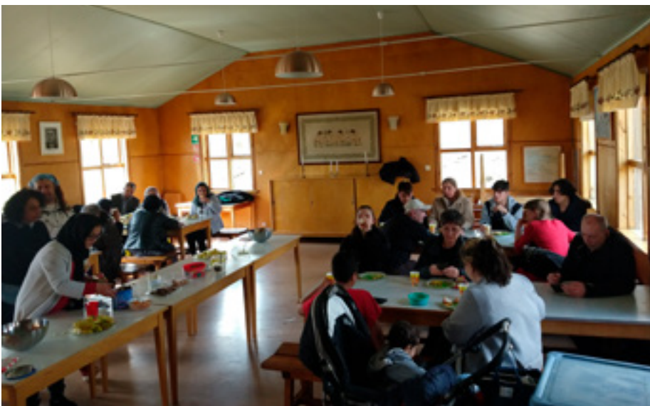
Viðkoma í Vindáshlíð.