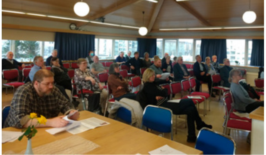
Þátttakendur á aðalfundi 2022

Gjaldkeri kynnti einnig fjárhagsáætlun sem er upp á rétt tæpar 100 milljónir og er