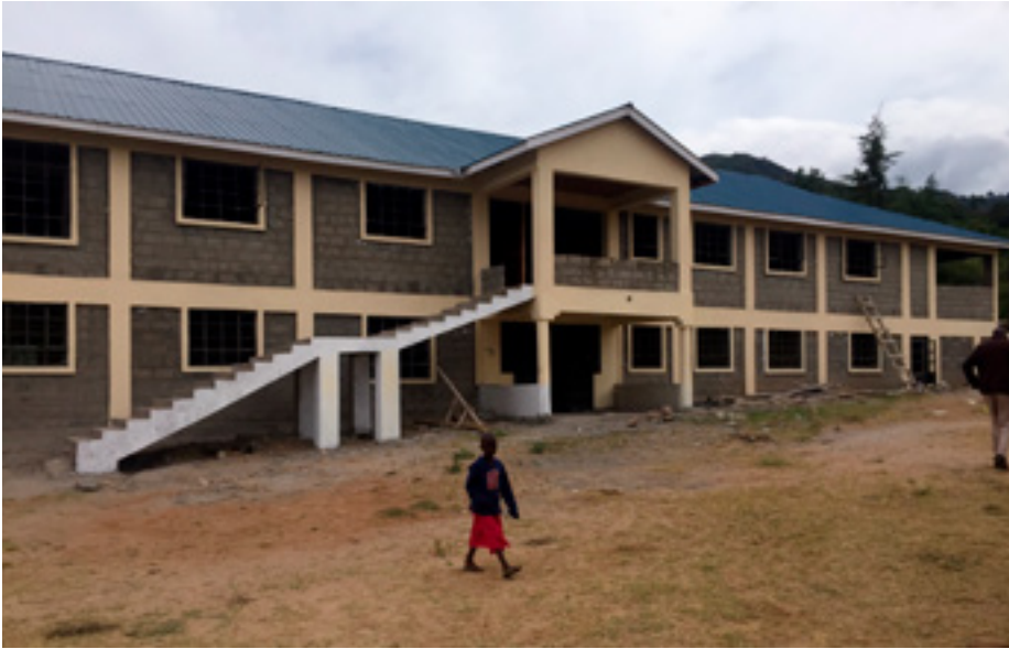
Nýjasta skólabyggingin við Propoi Girl's High School.

30 kennslustofur, 15 heimavistir og fleira á 15 árum