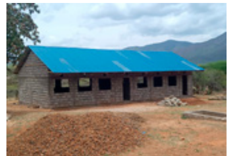
Ný bygging við grunnskólann Napis Primary School í febrúar 2022

Kristniboðssambandið greiðir meginhluta kostnaðar við boðunar- og útbreiðsluverkefni kirkjunnar á nýjum stöðum í Pókothéraði og nágrenni. Vaxandi áhersla er á Baringo, þar sem pókot-málið er líka talað en það liggur austur og hefur verið kallað Austur-Pókot. Verkefnið er með prédikara og presta á sínum snærum og greiðir launa- og ferðakostnað með styrk Kristniboðssambandið.