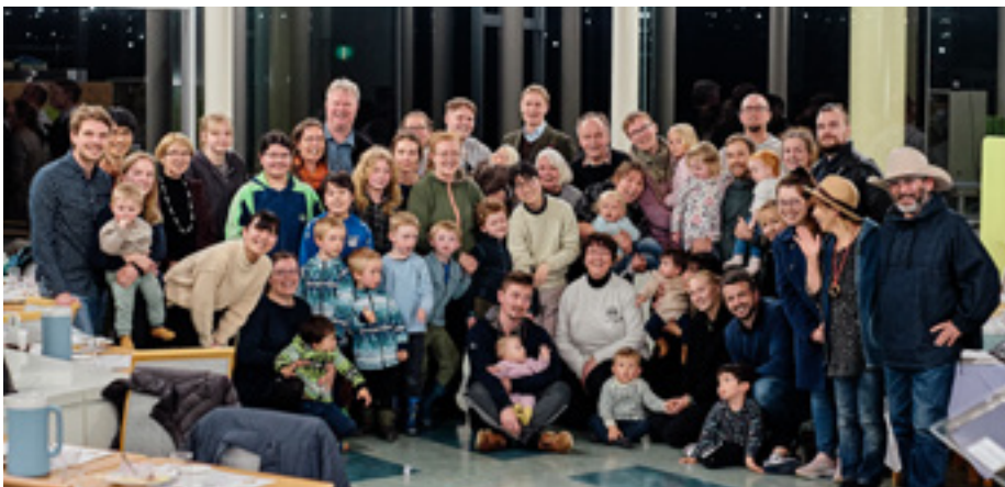
Norskir og finnskir kristniðóðar ásamt samstarfsfólki.