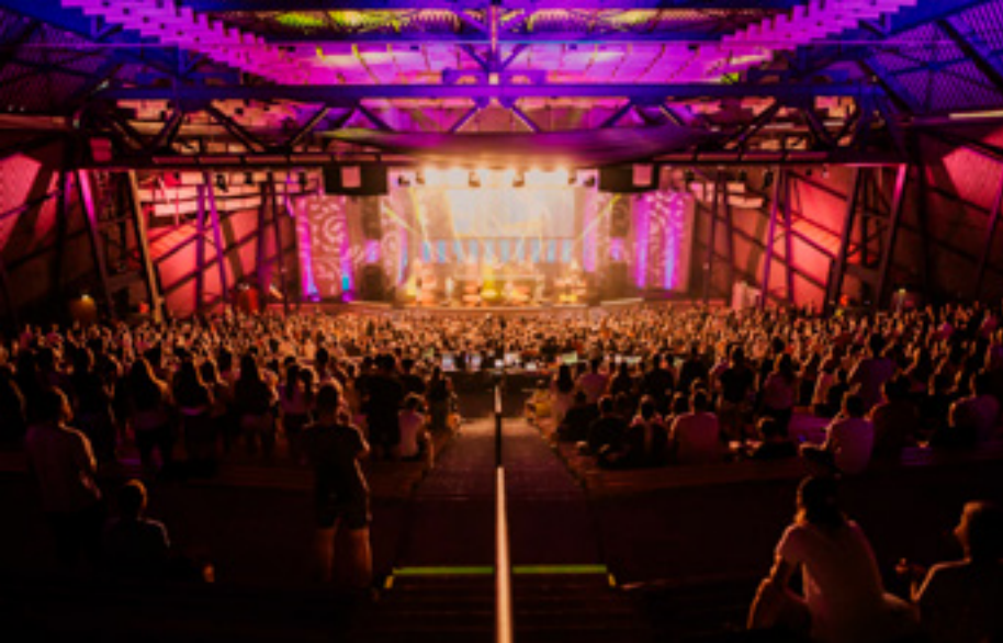
Frá landsmóti ungmennasamtaka NLM

Á mjallahvítum degi í mars fengum við, hópur af fólki frá ungliðahreyfingu norska Kristniboðssambandsins - (Misjonssambandet Ung, áður NLM - Ung), að koma til Íslands. Það leið ekki á löngu áður en landið heillaði okkur upp úr skónum. Landslagið, það að upplifa allar fjórar árstíðirnar á einum degi, hafa aðgengi að opnum stórmörkuðum allan sólarhringinn, gómsætur lakkrís, ís í kílóavís, að ógleymdum heitum laugum og sundlaugum í fimm mínútna fjarlægð hvar sem maður er staddur, mun seint gleymast. Í stuttu máli þá dýrkum við Ísland!