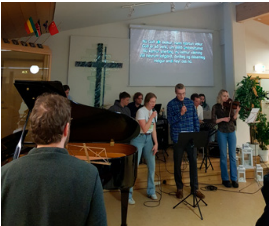
Sungið á unglingasamkomu.