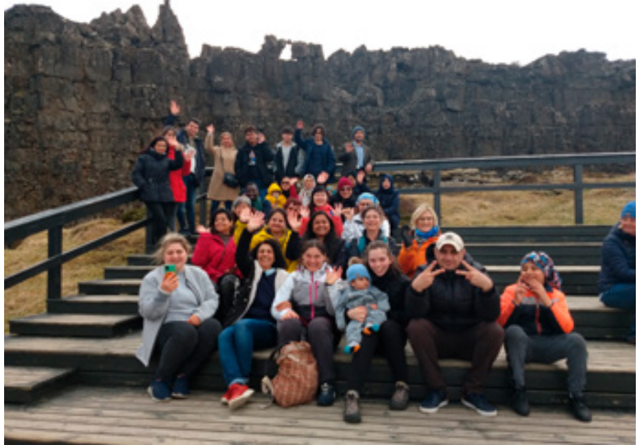
Hópurinn á Lögbergi.