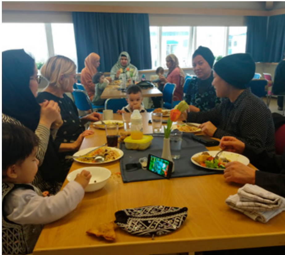
Spjallið svifur létt með góðum mat.

Mig langar líka sérstaklega að biðja ykkur kristniboðsvini að muna eftir afgönsku nemendum okkar. Ástandið í Afganistan er enn mjög slæmt þrátt fyrir að nú sé lítið fjallað um það í fjölmiðlum héraendis. Við erum með nemendur sem upplifa sig bjargarlausar hér á meðan fjölskyldumeðlimir þeirra lifa í felum og í stöðugum ótta um líf sitt undir ógnarstjórn Talibana í Afganistan. Þetta er oftast en ekki ungt fólk, vart af táníngaldri, sem hefur verið að berjast fyrir mannréttindum og