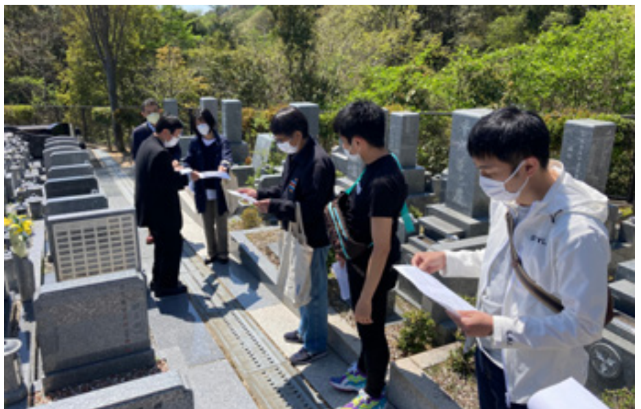
Þáskamorgunn við grafreit sem söfnuðurinn á.