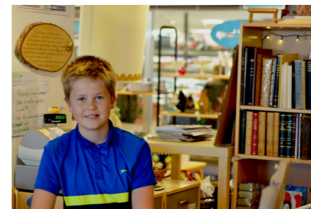
Ungur sjálfboðaliði á Basarnum

Basarinn er ekki einungis nytjamarkaður heldur einnig starfsstöð þar sem sjálfboðaliðar og starfsmenn komast í samband við fólk, kynna starfið, spjalla við það, veitir sálgæslu og fyrirbæn og fólki er boðið að taka þátt í starfi Kristniboðssambandsins. Basarinn heldur úti Facebook síðu sem tæplega nítján hundrað manns hafa merkt við sem ánægjuefni. Salan í Basarnum jókst aðeins í fyrra miðað við árið á undan.