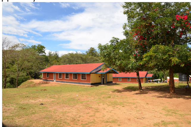
Nýr skóli og heimavist fyrir stúlkur. Samvinna Íslands og Keníu.

Breytingaferli fylgir opnun á aðrar breytingar og kristni var almennt fagnað og ekki þurfti að leita uppi áheyrendur.