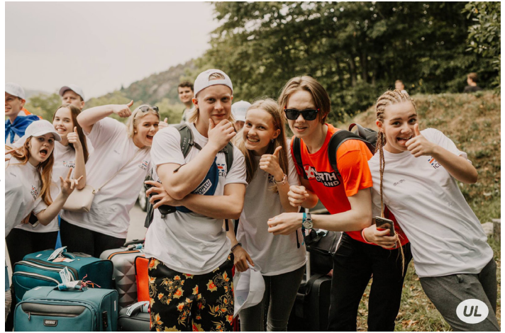
Hluti íslenska hópsins í fyrra á góðri stundu.