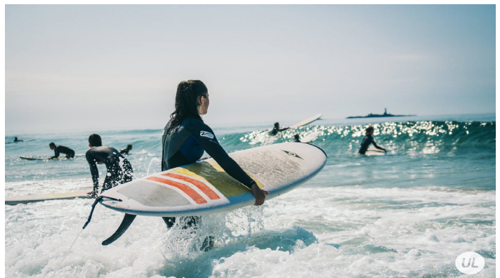
Já, svona var þetta: Sól, sjór og hiti. Vonandi aftur í sumar.