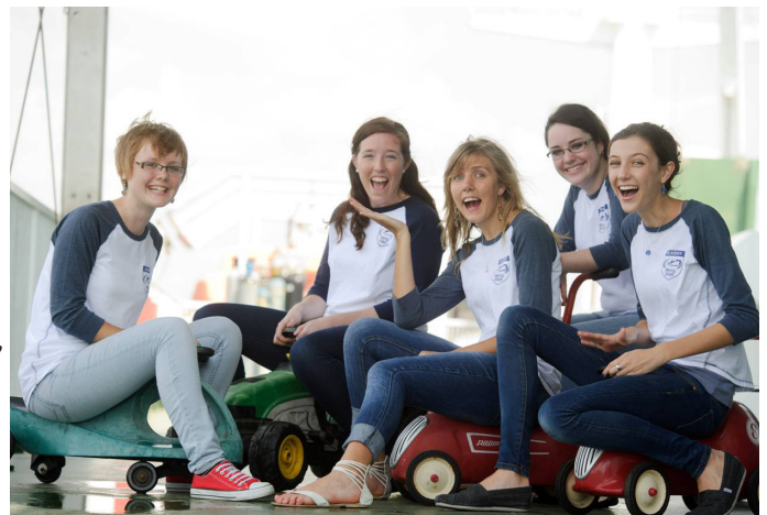
Glaðbeittir læknanemar um borð, til þjónustu reiðubúnir.

Verið miskunnsöm, eins og faðir yðar er miskunnsamur. Lúkas 6:36