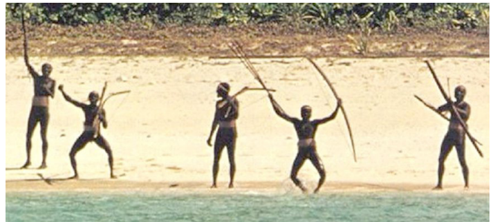
Íbúar eyjunnar láta örvum rigna yfir alla þá sem fara of nærri