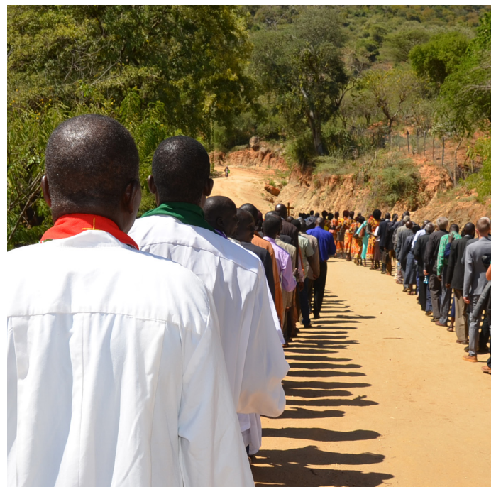
Fram fram fylking...