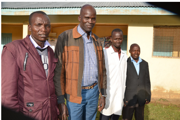
Nokkrir gamalreyndir leiðtogar kirkjunnar í Pókot

Þetta kristniboð, okkar Íslendinga og Norðmanna á þessum afskekktu og fyrrum hættulegu slóðum, hófst þegar kristniboðið varð að draga saman seglin í Epíópíu vegna byltingar og ófriðarástands þar.