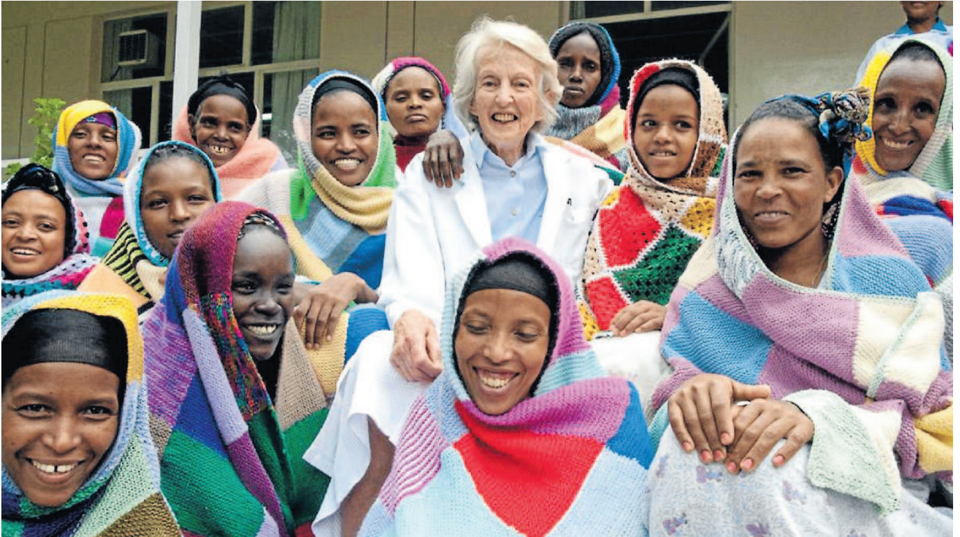
Gleði þeirra kvenna sem hljóta lausn frá fistli er ósvikin. Hér er dr. Catherine með nokkrum þakklátum skjólstæðingum.

Árið 1974 kallaði Guð áströlsku hjónin Reg Hamlin og Catherine Hamlin til starfa í Eþíópíu. Þau voru bæði skurðlæknar og höfðu ákveðið að opna spítala sem sérhæfði sig í fistli (e. fistula) sem er rof í fæðingarvegi í kjölfar meðgöngu og fæðingar vannæðra kvenna og barnunga stúlkna. Þetta var og er algengt vandamál í Eþíópíu en um leið vandlega falið því skömmin er svo mikil. Á meðal afleiðinga fistils er að geta hvorki haldið þvagi né hægðum og því er konunum útskúfað og þær lenda oft í algjörri einangrun og andlegu myrkri. Með skurðaðgerð er í 80% tilfella hægt að gera konurnar heilbrigðar og gefa þeim nýtt líf.