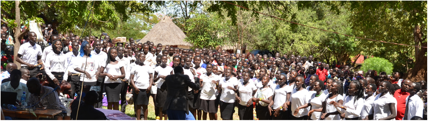
Söngurinn í Pókot lætur engan ósnortinn. Afmælishátíðin gaf gott tækifæri til þess að syngja Guði til dýrðar.