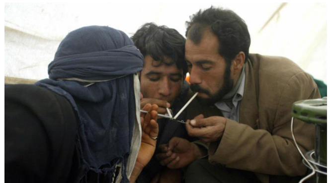
Ópíumfíkn er ört vaxandi vandamál í Íran