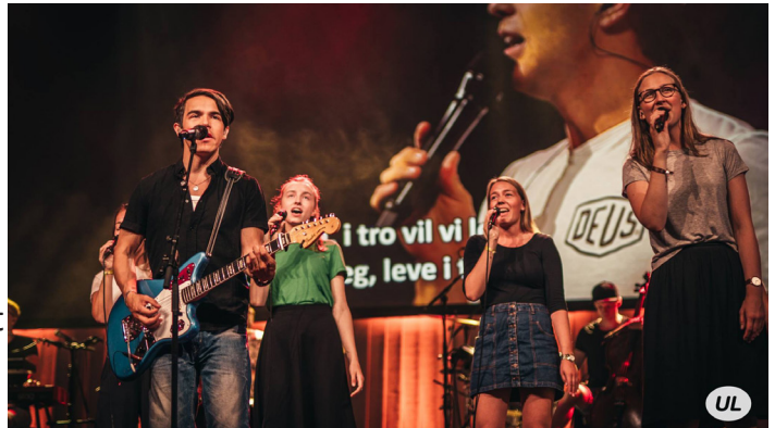
Á UL er mikið lagt upp úr góðri tónlist og lofgjöfð.