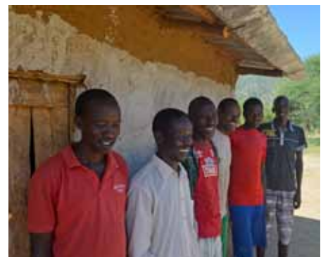
Öldungar í Zegarma og yfirmenn starfsins.