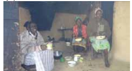
Tengdamóðirin ásamt fyrstu og annari eiginkonu sonar hennar.