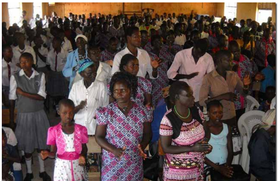
Guðsþjónusta í Propoi.