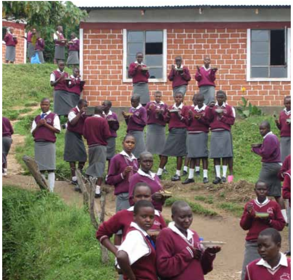
Stúlkur í framhaldsskólanum sem Kristniboðssambandið byggði í Propoi.

„Þegar smá stund gefst frá kennslunni þá eru stöðugar heimsóknir og beiðnir um aðstoð. Mest eru það foreldrar sem koma og biðja um hjálp vegna skólagjalda barnanna. Þetta er mjög mikið vandamál hér og liggur þungt á foreldrum sem vilja að börn þeirra fái góða menntun. Það er helst ríka fólkið sem hefur efni á greiða skólagjöld fyrir börn sín. Margir góðir nemendur sitja heima vegna þess að þeir hafa ekki efni á að greiða skólagjöld framhaldsskólans sem eru 70-100 þúsund krónur á ári. Mánaðarlaun verkamanna eru um 6000 á mánuði. Með hjálp, sem við fengum frá Íslandi og Noregi nú í janúar, gátum við hjálpað 25 nemendum með fjórtán þúsund króna styrk á mann. Allir sem fengu styrk eru mjög þakklátir þó þetta nægi ekki nema aðeins til að fá að byrja í náminu. Ég er með á biðlista nöfn á 41 nemanda sem við getum ekki hjálpað og fleiri bætast við þegar nem-