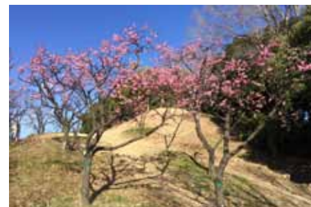
Plómutrén í Japan blómstra í febrúar.