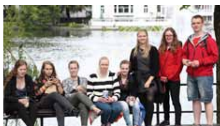
Frá UL síðasta sumar.

Fimmtudaginn 25. febrúar koma gestir frá NLM-ung í Noregi og taka þátt í fundi hjá Kristilegu stúdentafélagi (KSF). Gestirnir starfa að boðun og kristniðóðskynningu meðal ungs fólks í Noregi. Markmiðið með ferð þeirra til Íslands er að hvetja ungt fólk til að taka þátt í kristniðóði og fara á UL mót (Ungdommens landsmöte) í Noregi í sumar.