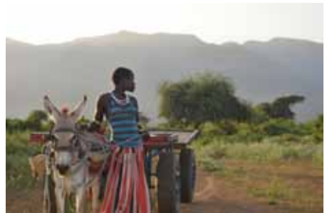
Voitó stúlka með nýjung í Voitó, asnakerru.