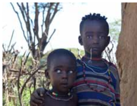
Drengur og stúlka í Zegarma.