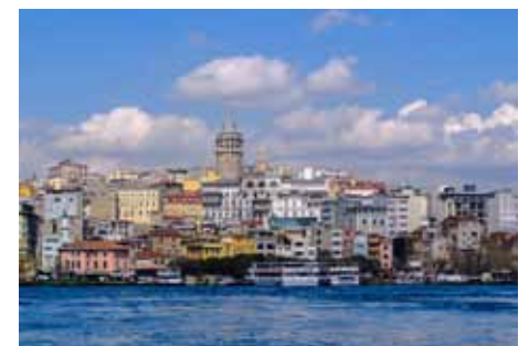
Frá Istanbul í Tyrklandi.