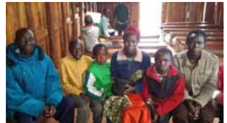
Eiginmaðurinn, fyrsta konan (með hæruna) og dóttirin lengst til hægri sem kom og þakkaði fyrir hjálpina.