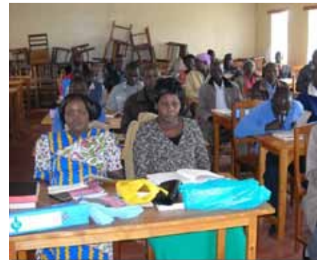
Verðandi djóknar og prédikarar í kirkjunni í Pókot.