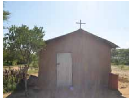
Kirkjan í Zegarma.